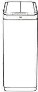
取扱説明書 X-WING センサービン EK9387R

この度は X-WING センサービンをご購入いただきありがとうございます。 ご使用になる前にこの取扱説明書をお読みいただきますようお願い申し上げます。 なおイラストは現品と異なる場合がございますので予めご了承ください。